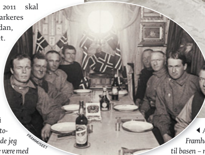
◀ Amundsen hadde etablert en base under ekspedisjonen sin; Framheim. Her er karene i feststemning etter å ha kommet tilbake til basen – nesten halvannen måned etter at de nådde Sydpolen.