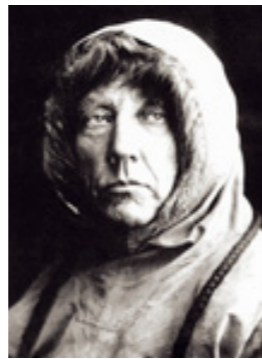
Roald Amundsen, 1872–1928.

– Mye. På det mentale planet, selvsagt. Men også på det praktiske, særlig fordi vi