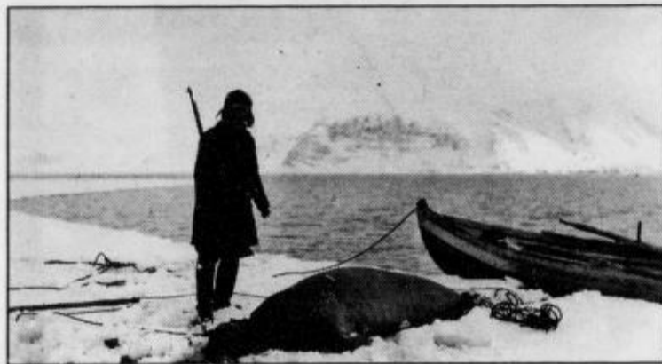
FARLIG Jakt på storkobbe foregikk i småbåt, var spennende og ikke ufarlig.