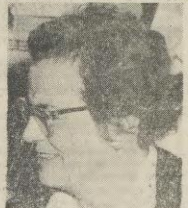
Nic Waal, hvis bok «Er det foreldrenes skyld?», som nå er utkommet på Cappelens forlag.

Da den kjente norske barnepsykologen, overlege Nic Waal døde i 1960, hadde hun nylig utgitt i Sverige en bok med tittelen «Det finns inga stygga