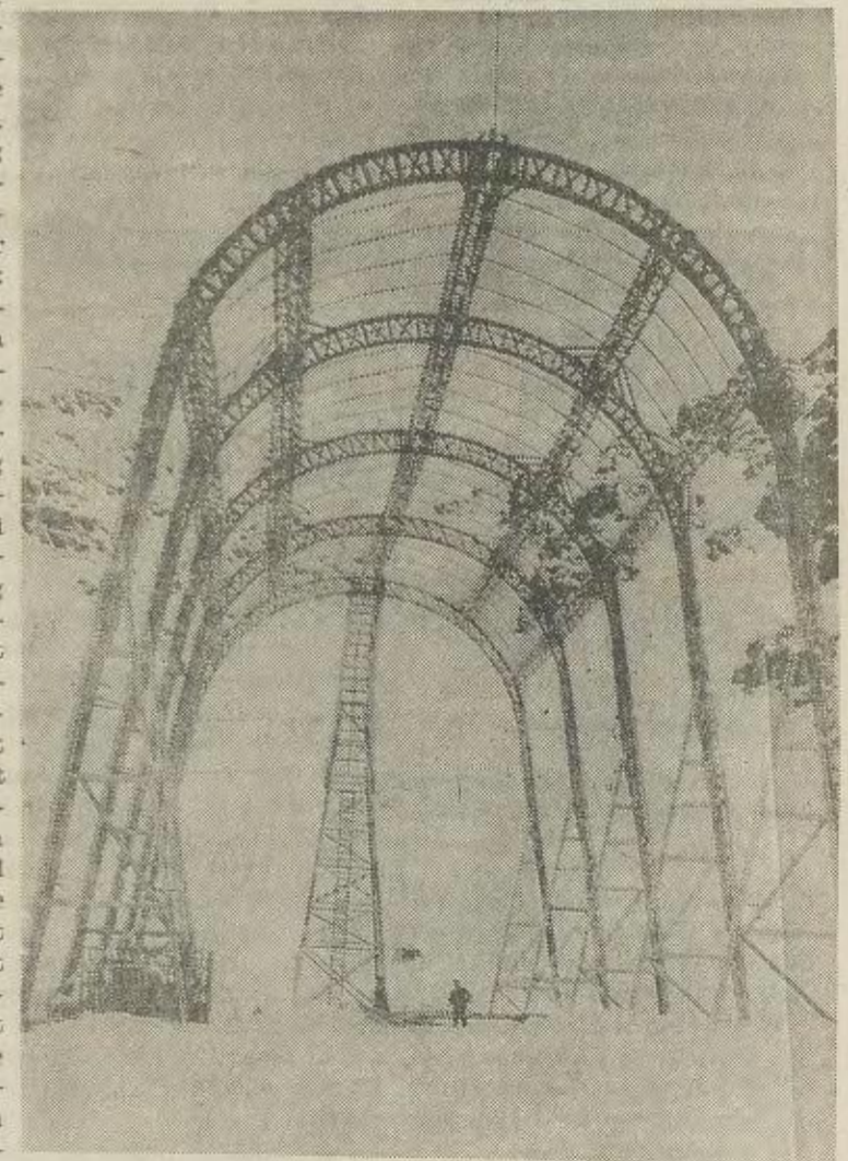
Et bilde av den første luftskipshallen som ble bygd i 1906. Den blåste ned om vinteren 1908 — 09.

Wellman var luftskipsskipper — presis kl. 10.00 den 15. august ga han startsignalet og skipet tok av. Men det skulle vise seg at ferden ikke varte lenge. Ca. 10 mil hadde man fløyet og var kommet nord for Amsterdamsøya, da en kombinert ballanse-slepetrosse som også var lastet med 500 kg proviant trakk like ved festet oppe på «America». Trossen ble slept etter på isen, men da den brakk, resulterte det i at skipet ikke lenger kunne manøvreres. Det forsøkte å snu, men forgjeves, og man måtte nødløse. Ekspedisjonsfartøyet «Farm» var like i nærheten, og så hva som hendte. De gikk til unnsøtning, og klarte å slepe «America» tilbake til Virgobay. Under arbeidet her med å få skipet fortoyd, — skjedde det neste og katastrofale uheldet. Gassen inne i skipet var så smått begynt å lekke ut — og man hadde ingen kontroll over denne lekkasjen da det oppsto feil med gasskontrollventilen. Skipet reiste seg ende opp, og gassen unnslopp. Det hele endte med at luftskipet med et brak falt ned og totalhavarete. Wellman besluttet da å gjøre nye forsøk neste sommer — 1910, og ekspedisjonen bega seg dermed på reisen tilbake til Norge og Europa. — Mesteparten av materiellet ble på Svalbard med et par mann til å passe på det.