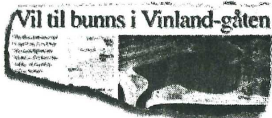
FAKSIMILE AFTENPOSTEN 9. JANUAR