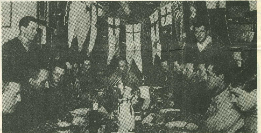
Robert Scott – ved bordenden – feirer sin fødselsdag for siste gang, 6. juni 1911, i hytta på Kapp Evans.

Blant dem som går til angrep på filmen er polarforsker Vivian Fuchs. Han er kommet med en bemerkning som må glede Huntford og Griffith: «Jeg er sterk motstander av å trække på folk som er en del av vår historie».