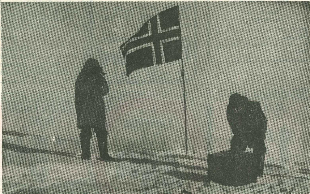
Roald Amundsen, til venstre, på Sydpolen 14. desember 1911.

Klasseforskjell var et praktisk talt ikke-eksisterende fenomen i det fattige Norge, som nettopp hadde løst seg fra Sverige. Begrepet var ukjent for Amundsen, født 1872 i en familie av skipsførere. Men at nasjonalfølelse motiverte Amundsen – briljant og kjølig framstilt av Sverre Anker Ousdal – er klart. Nordmannen hadde et brennende ønske om å plante Norges flagg på Sydpolen.