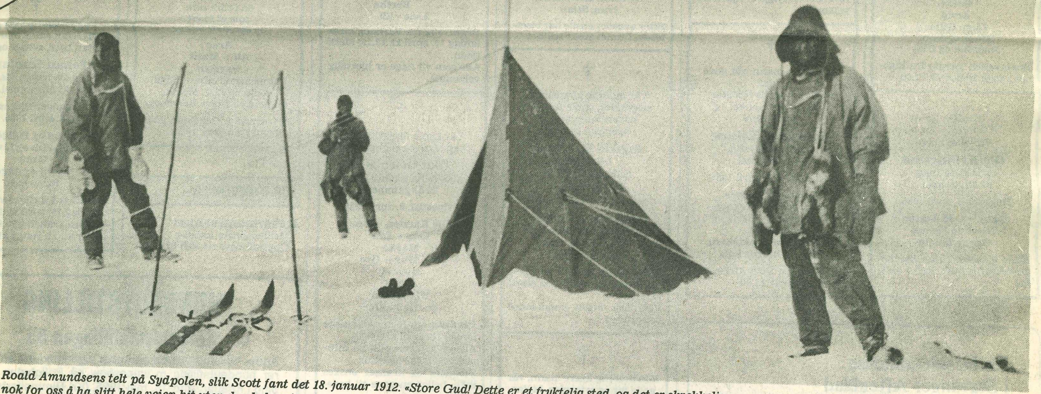
Roald Amundsens telt på Sydpolen, slik Scott fant det 18. januar 1912. «Store Gud! Dette er et fryktelig sted, og det er skrekkelig nok for oss å ha slitt hele veien hit uten den belønning å være først.»