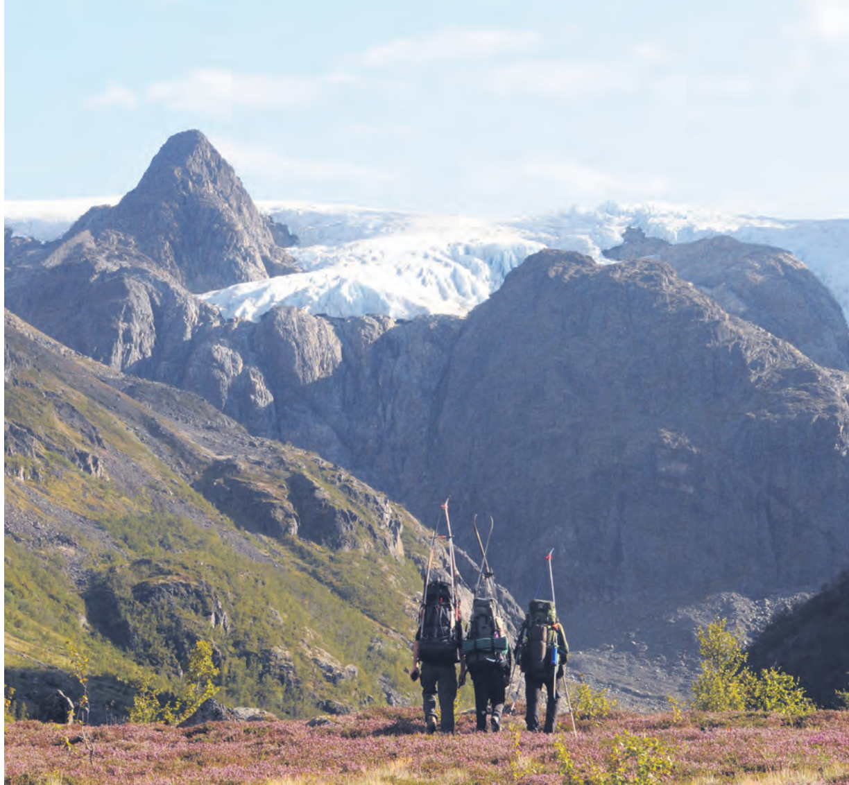
Isdalen under Øksfjordjøkelen i Finnmark.