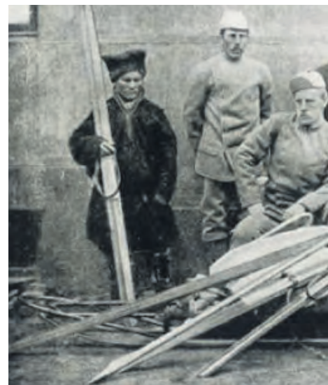
1888-89 ekspedisjonen til Grønland, f.v. Ole Ravna, Otto Svendsen, Christian Dietrichson og Samuel J. Balto.