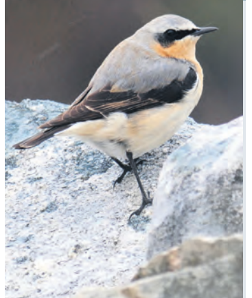
340 mil i eitt strekk er ikkje verst for ei flygemaskin på 25 gram.