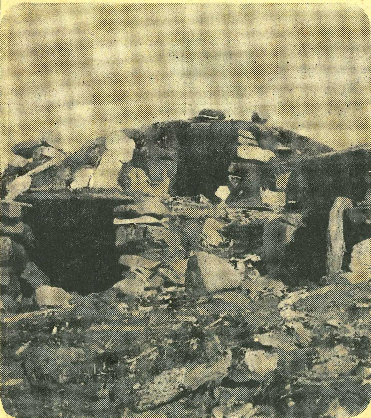
Polariskimoiske vinterboliger ved Thule. Hyttene eies ikke av noen bestemt familie, men tas i bruk av en av dem som bestemmer seg for å overvintre. Polareskimoene er et nomadefolk, som følger villtet på vandringene.