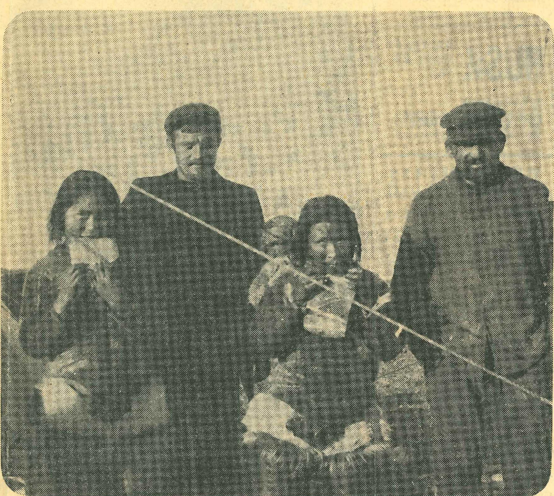
Tømmermannen og maskinpasseren ombord fotografert sammen med to eskimokvinner. De bærer sine barn i bæreposer på ryggen, og de tygger på hver sitt skinn.

Jeg kan fortelle et par sammenhengende episoder fra samværet med Knud Rasmussen. Han bød meg inn i teltet sitt, som var langstrakt. Han satt selv innerst med ansiktet vendt mot inngangen. På høyre side av ham satt Freuchen, og på venstre side satt jeg. Nedenfor Freuchen og meg satt det en rekke eskimomenn på jorden med bona