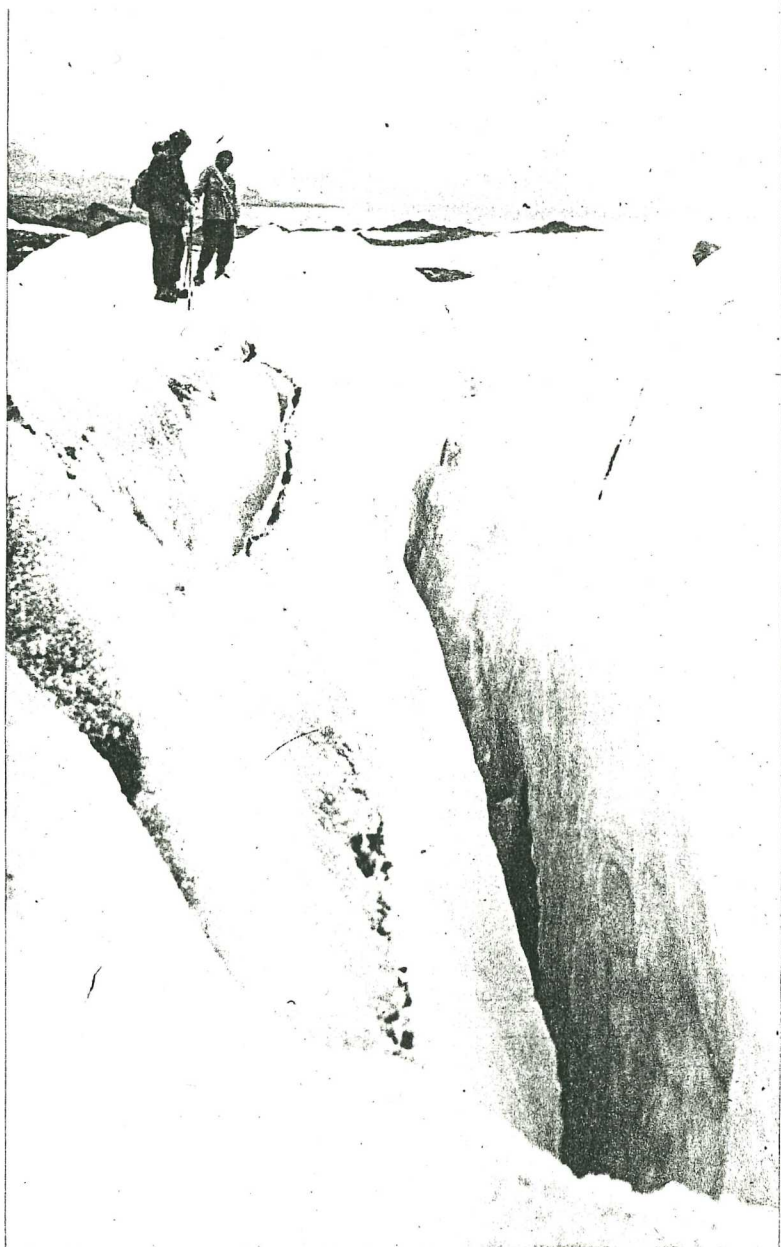
Her står den modige wienerinnen på kanten av en av de mange livsfarlige sprekkene på Kongsbreen.

Så rent få kunnskaper er det ikke hun har ervervet seg siden hun i 1952 for første gang satte foten på den skrinne Svalbard-jorda i Longyearbyen. For hun har fartet rundt med åpne sanser og en våken forståelse for alt det som rører seg i naturen. Fossiler har hun studert, hun kjenner hver eneste plantesort og har endog selv oppdaget en plante — en