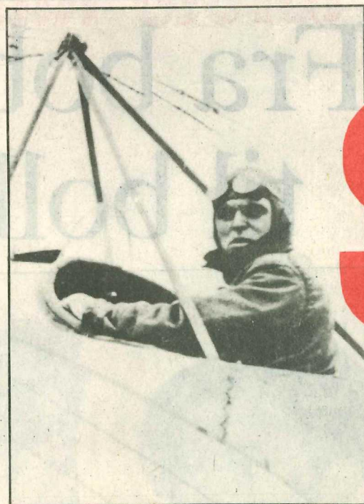
Tryggve Gran, Bildet er tatt i Cruden Bay i Skottland.

Scott-eksped- sjonen legger iveri mot Sydpolen. (Fra filmen og Scott og Amund- sens kappløp i 1911)