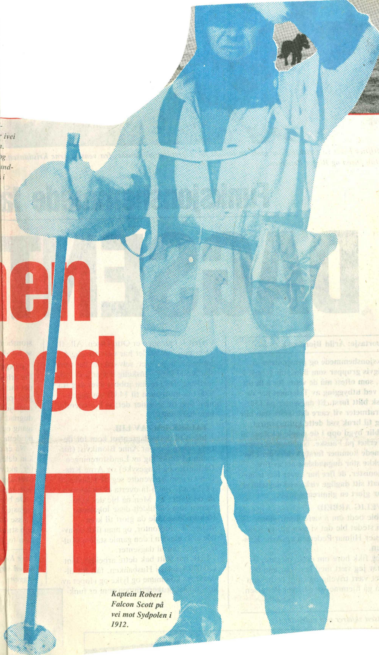
Kaptein Robert Falcon Scott på vei mot Sydpolen i 1912.

Scott-eksped- sjonen legger iveri mot Sydpolen. (Fra filmen og Scott og Amund- sens kappløp i 1911)