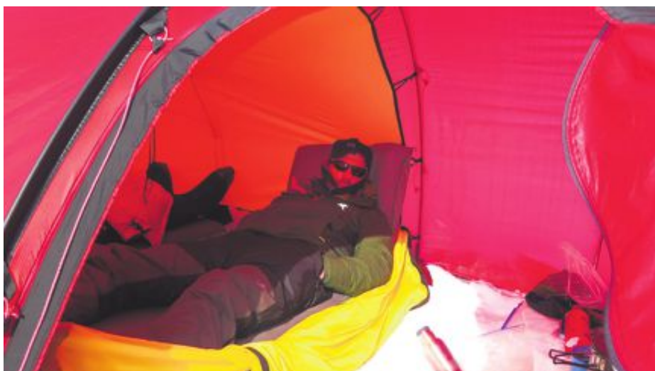
«Ein skikkeleg polfarar må kvile når han kan.» Eg kan ikkje sitere nokon på akkurat den...

Neste morgon prøver Vegard seg på nytt: «Gjøahavn eller døden!»