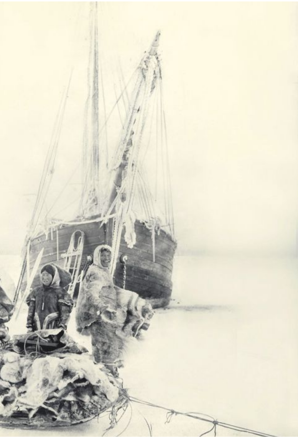
Amundsen og inuittene. Dei kunne lære han mykje om korleis ein overlever i polarstroka.

«Terrænet omkring Gjøahavn var det mest kuperede paa hele Kong Williams Land», skreiv Amundsen, «hvilket forresten ikke vil si meget». Nettopp! Du treng ikkje akkurat vere fjellklatrar for å dra på tur her. Men det er ei morosam avveksling å segle over land. Formasjonane endrar seg. Me dreg gjennom noko eg kan førestille meg er ein dal, og over haugar som eg likar å tru er fjell. Farten er god og kursen rett mot målet.