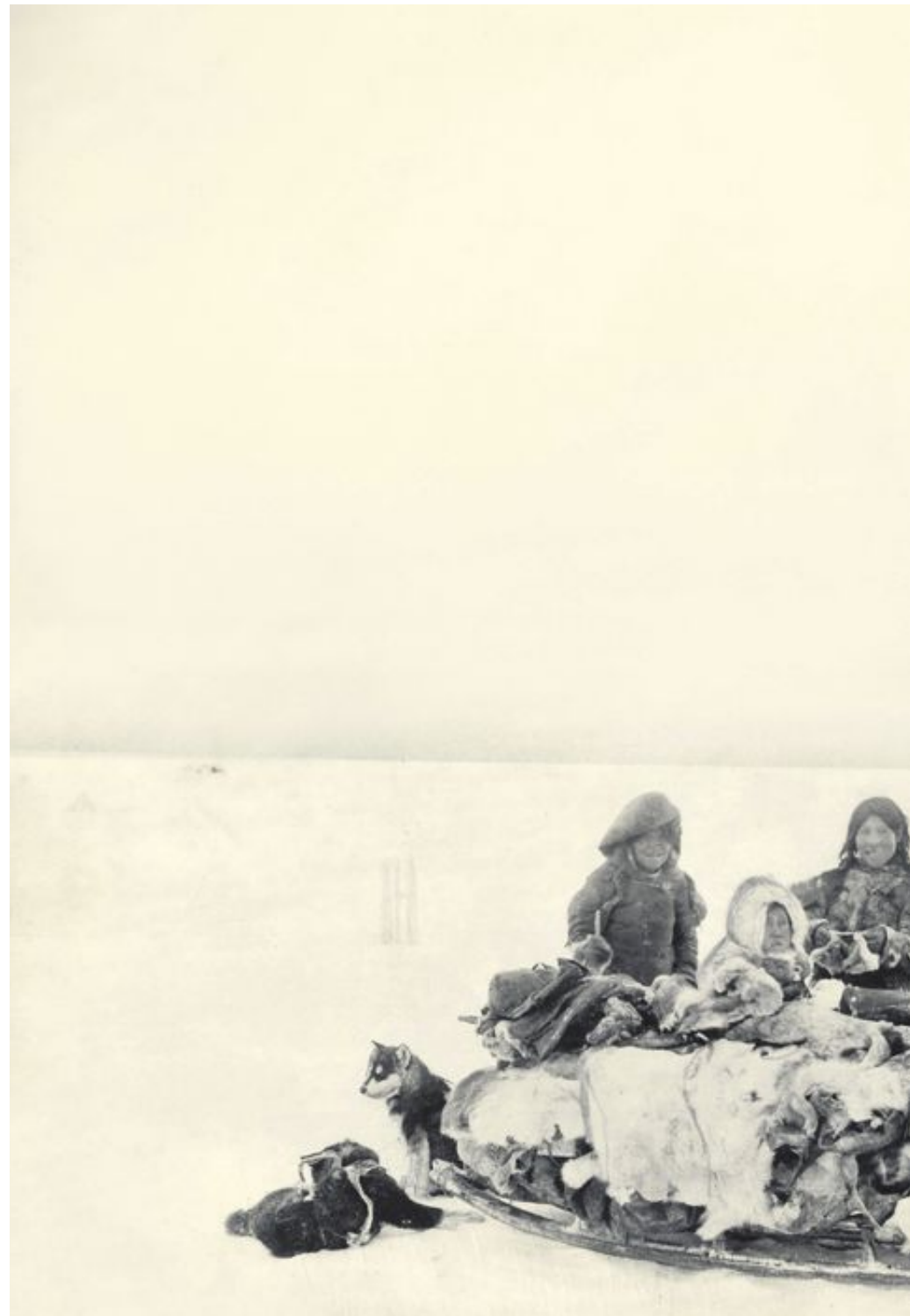
«Gjøa» ankra opp på staden som skulle få namnet hennar, Gjøahavn – eller Gjoahaven som det heiter lokalt. Her møtte Roald Amundsen...

Kor om alt er. Me har uroa oss utan grunn for namnet på kartet. Storis Passage er ikkje ein anglisert omtale av tilhøva. Namnet kjem rett nok frå dansk, men stammar frå ein isbrytar som amerikarane bygde under andre verdskrigen for å patruljere farvatnet rundt Grønland. Skuta skulle eigentleg namngjevast