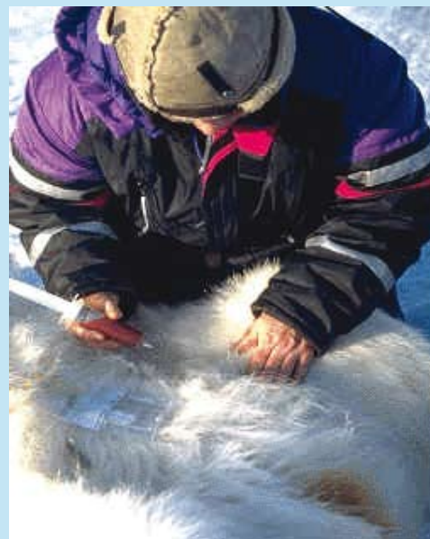
Innsamling av blodprøver fra isbjørn.

Videre forskning på mekanismene bak dette har vist at forurensning påvirker både enzymer som bryter ned fremmedstoffer i leveren og blodet (CYP-enzym), hvite blodlegemer og proteiner i det ervervede immunforsvaret (immunoglobuliner). Slike effekter ble funnet når nivåene av PCB oversteg 25 – 89 nanogram per gram