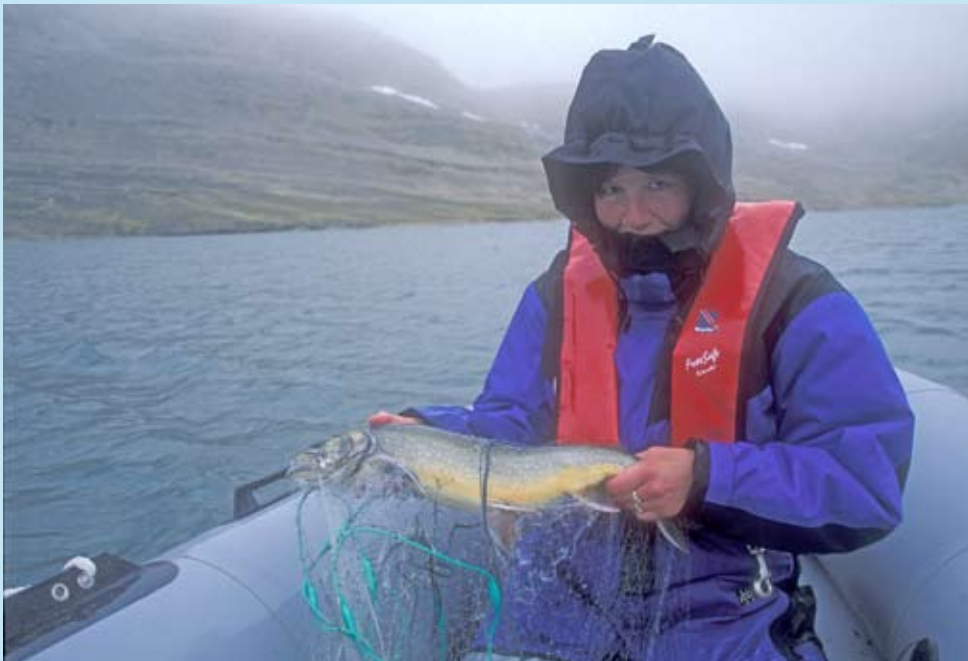
Røye i Ellasjøen har unormalt høye nivåer av miljøgifter.