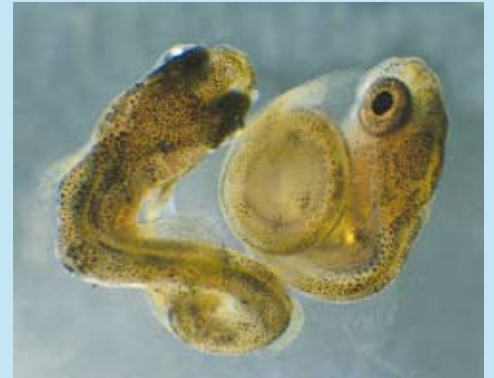
Yngel av røye viste misdannelser etter å ha fått PCB-holdig fôr.