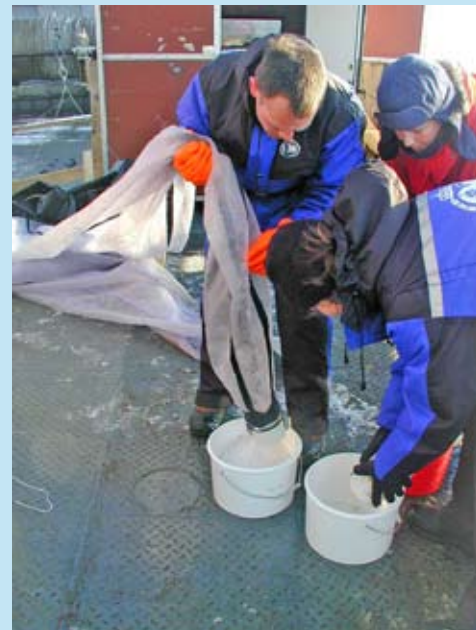
Tømming av nettet som er brukt til å fange plankton.