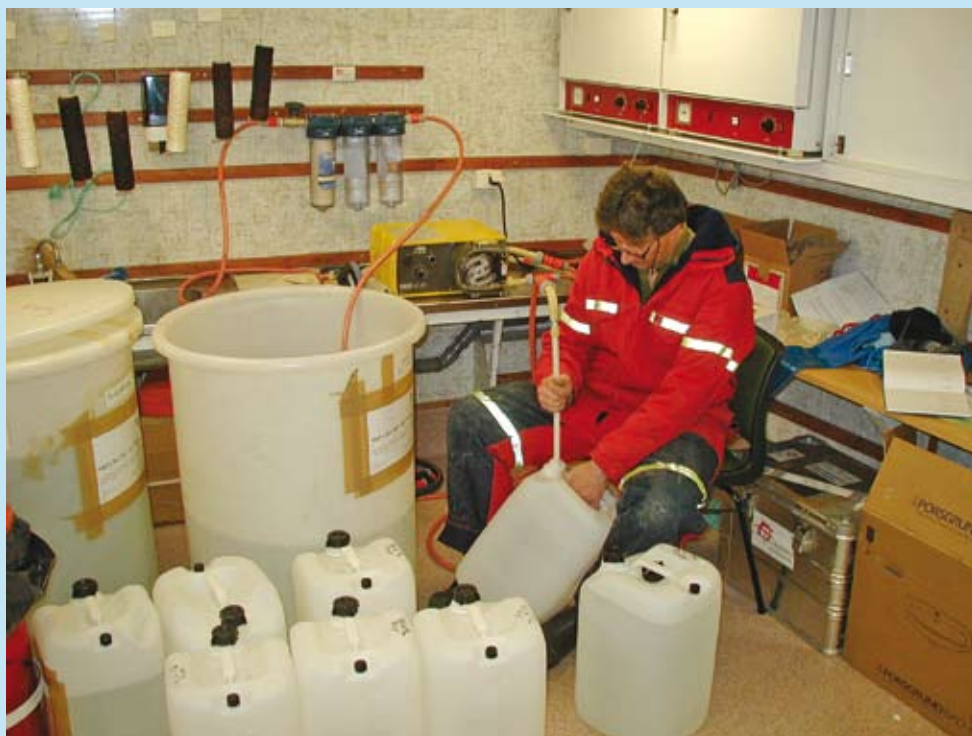
Det må store vannmengder til for å måle radioaktivitet i vann.

Beregning av doser til mennesker fra Barentshavet, viser at konsum av fisk er hovedkilden. Cesium-137 står for 90% av strålebidraget, mens strontium-90 og plutonium står for ca 5% hver. Den beregnede kollektive doseraten på 0,03 personSievert per år kan anses som ubetydelig.