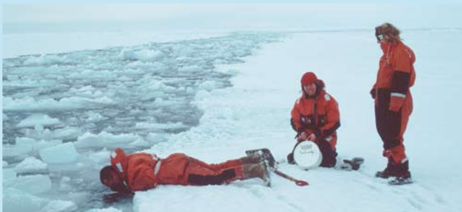
Norsk Polarinstitutt og Akvaplan-niva var blant de første som tok prøver av miljøgifter i iskantsonen i europeisk Arktis.

I vann er det vanskelig å måle miljøgifter fordi mange av stoffene er lite vannløselige, nivåene lave og måleteknikkene usikre. For PCB ble det f.eks. målt nivåer på bare rundt et halvt pikogram (= 10^{-12} gram) pr. liter vann. Sprikende resultater viser at det trengs videre utvikling av måle metodene.