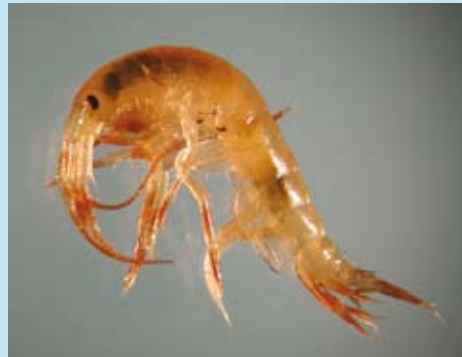
Isamfipoden Gammarus wilkitzkii skifter gradvis fra å spise planteplankton til dyreplankton i løpet av de 5-6 årene den lever. De eldste individene inneholder mest miljøgifter både fordi de akkumulerer stoffene gjennom livsløpet og fordi de skifter til å beite på et høyere nivå i næringskjeden.

Hos alger, dyreplankton og fisk utveksles miljøgifter direkte med sjøvannet de lever i. Dyreplankton og fisk vil dessuten både ta opp og skille ut miljøgifter i gjellene. Men selv for dyreplankton spiller også opptak gjennom maten en viktig rolle. Arter som spiser mest planteplankton har lavest nivåer, mens de som spiser mest av annet dyreplankton og dødt materiale har de høyeste nivåene. Studiene viste også at de største og eldste individene hadde høyest verdier og mest fettløselige stoffer. Dette viser at det kan være vanskelig å overvåke miljøgifter selv så lavt i næringskjedene uten å skille mellom arter som har ulik diett og evne til å omsette stoffene, alder og størrelse på individene, tid på året for prøvetakingen osv.