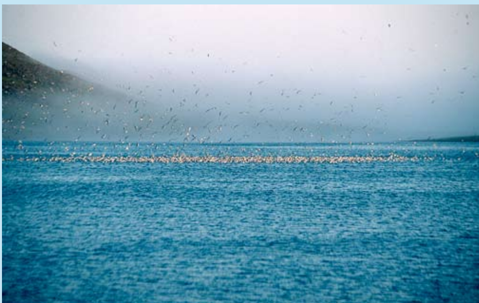
Et større forskningsprosjekt har vist at Ellasjøen på Bjørnøya får tilført mye miljøgifter gjennom store avsetninger fra nedbør og tåke. I tillegg lager store fugleflokker som bruker sjøen en biologisk transportvei fra havet (guano, fjær etc). Les mer i tidsskriftet Ottar, nr 253/ 2004.

Programmet finansierte også en studie hos NTNU med oppdrettsrøye som stammet fra en anadrom bestand på Svalbard (Disetvannet). Halvparten av fiskene i ekseperimentet fikk mat tilsatt et PCB-produkt. Fordelen er at man da vet hva påviste effekter skyldes. På den annen side blir ikke sammensetningen av miljøgifter slik man finner i naturen. I dette tilfellet var nivåene også høyere.