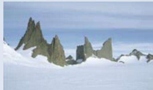
DRONNING MAUD LAND