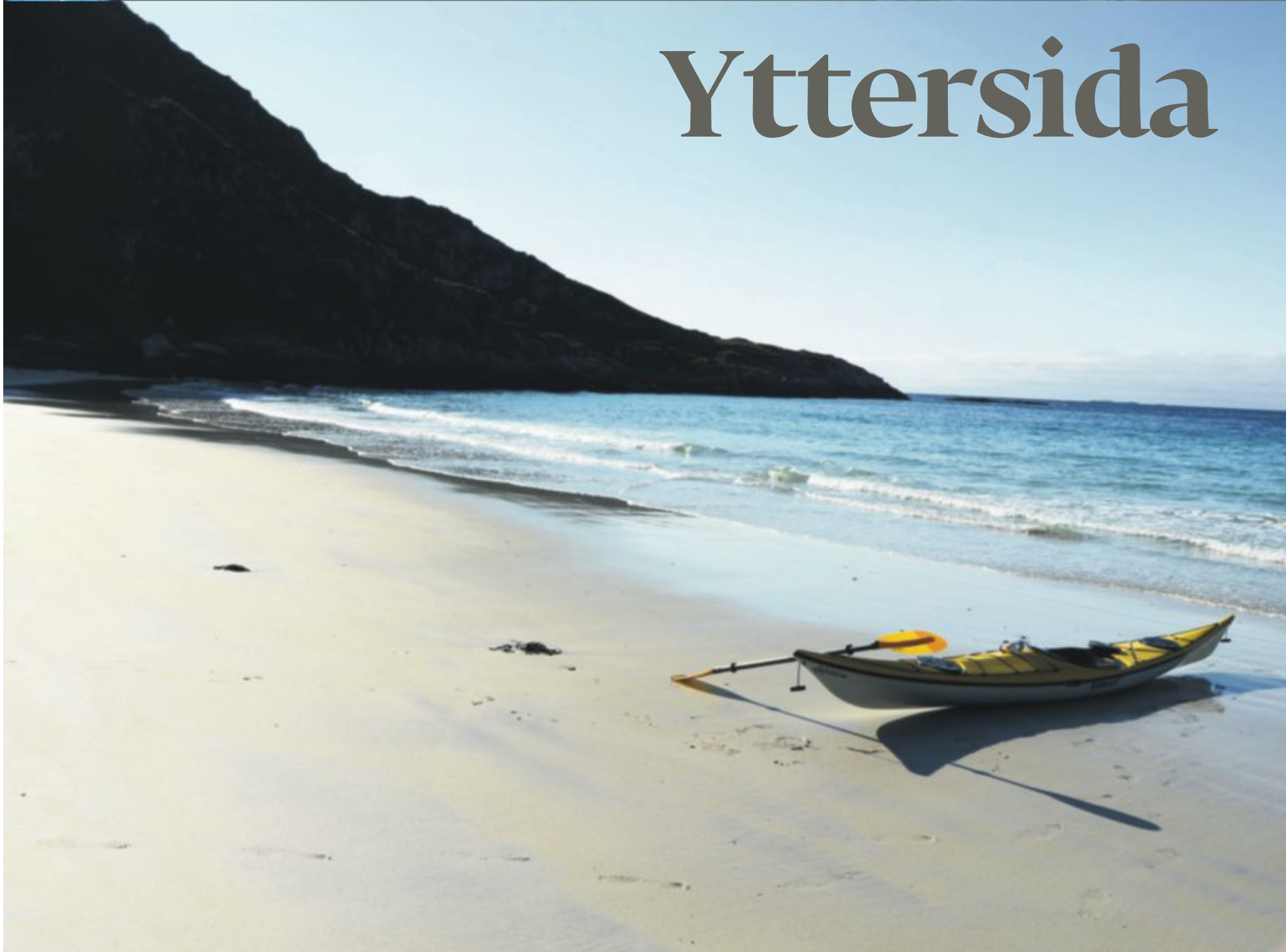
Kajakken og havet. På yttersida av Grøtøya i Troms.