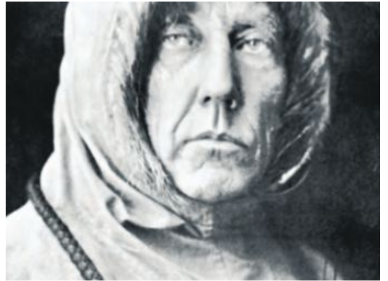
Roald Amundsen (1872–1928).