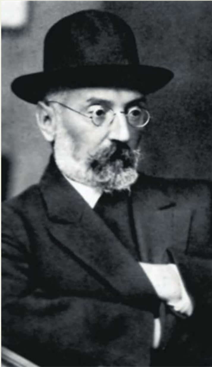
Miguel de Unamuno y Jugo (fødd 29. september 1864 i Bilbao, død 31. desember 1936) var ein spansk forfattar, dramatikar og filosof.

Han kunne nok vera både ego-sentrisk og eksentrisk, men han var samstundes til stades blant og for menneska som omgav han, og for samfunnet, kanskje litt på same måten som den gode, ikkje-truande presten i Martyren, den gode San Manuel som vel å ivareta livsløyna til menneska medan han