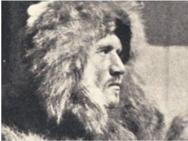
Hjalmar Johansen (1867–1913).

For ikkje å snakke om denne karakteriseringa av sørpollaget: «[Prestrud] var plaget av følelsen av å ikke strekke til. De andre mennene var seige og utholdende. Wisting, Hassel, Hanssen og Bjaaland var i tillegg mentalt stabile og syntes å ha medfødt tålmodighet. De lot seg ikke stresse under kritiske situasjoner, men gjorde oppgavene de ble tildelt uansett forhold. [...] Roald Amundsen utviste selv generelt et stabilt humør og en forutsigbar oppførsel.»